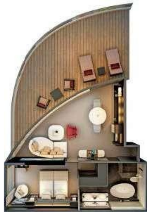
Panorama Suites 105 m 2