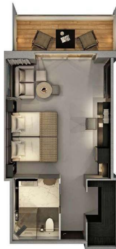
Grand Deluxe Verandah Suites 38-40 m 2