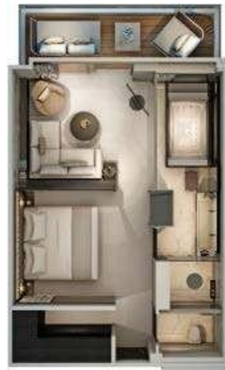
Spa Suites 46-50 m 2