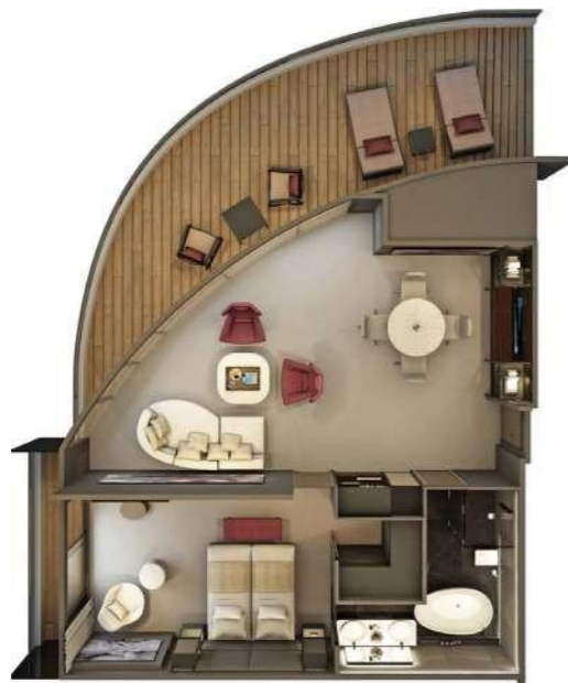
Grand Panorama Suites 110 m 2