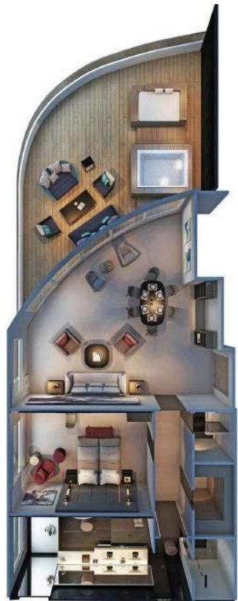
Owner's Penthouse Suite 195 m 2