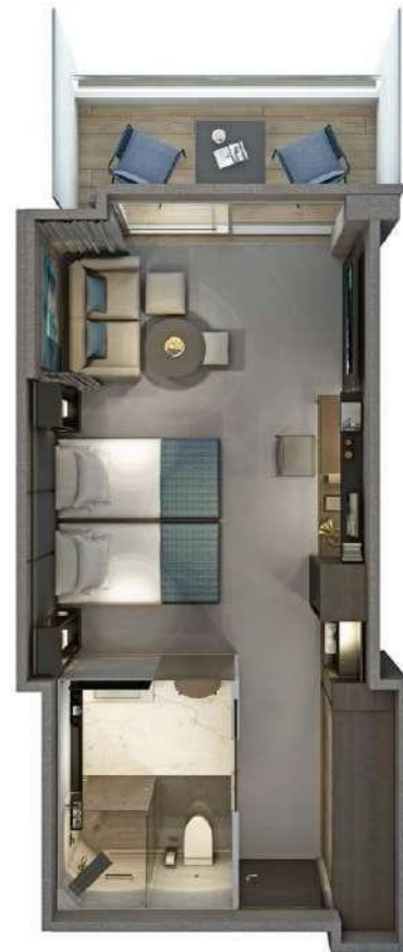
Verandah & Deluxe Verandah Suites 32-34 m 2